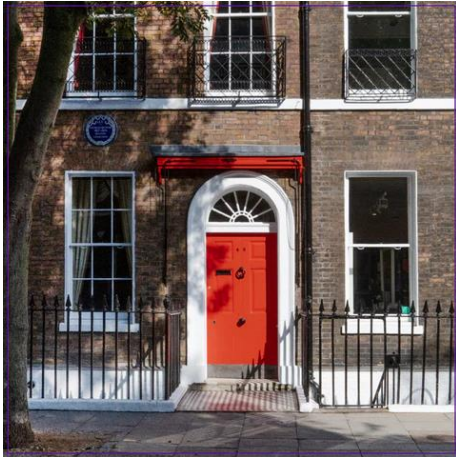
Charles Dickens museum och hem

År 1858 skiljde sig Charles Dickens och hans hustru Catherine Hogarth. Äktenskapet hade varit slitigt. Skandalen var ett faktum när det avslöjades att Dickens hade inlett en relation med den nittonåriga skådespelerskan Ellen "Nelly" Ternan.