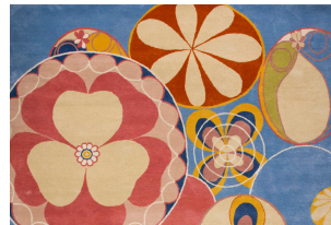
Hilma af Klint