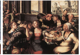
Catharina van Hemessen